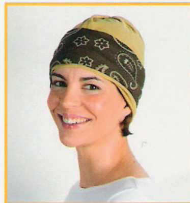
Muts + hoofdband