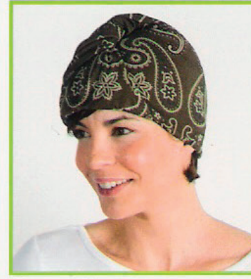
Muts met knoop vooraan