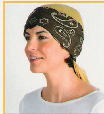
Saharian + hoofdband