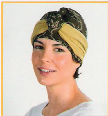
Muts met knoop vooraan + hoofdband