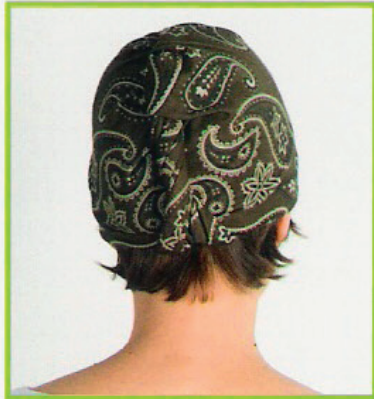
Muts met knoop achteraan